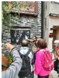
魯迅に愛された中国料理店は再建され健在