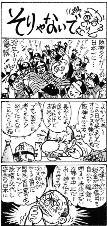
堺北支部 金森 丸人さん作

決議に法的拘束力はありませんが、イスラエルがガザで行っている空爆、封鎖、地上侵攻が国際人道法違反であることを批判しています。国連安全保障理事会が一致した行動をとれない中で国際社会の意思を示しました。国連決議は、国際人道法に基づいて民間人が保護されなければならないことを強調しています。「ガザ地区における壊滅的な人道状況」「子どもたちを含む一般市民への甚大な影響」を打開するため、人道支援物資が届くようアクセスの確保も求めています。