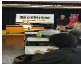
枚方女性部総会の様子