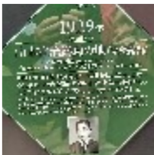
山宣のプレートの前で