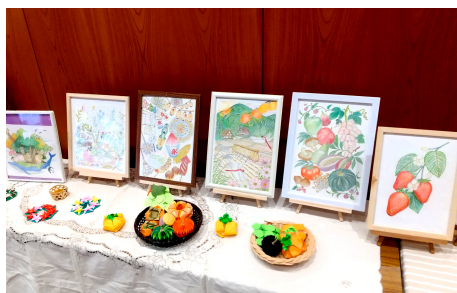
シルバークラフトに展示

現在は2箇所毎月1回ずつ、総勢約15名近いメンバーがいます。講師の人はいません。それぞれ