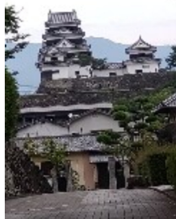
歴史を伝える大洲城