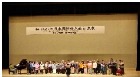
日本高齢者大会 in 東京全体会

12日(日) 会場 大正大学 13学習講座 14分科会 1360人 ブーム200人以上 13日(月) 会場 文京シビックホール 全体会(記念講演) 講師 柳澤協二氏 1500人