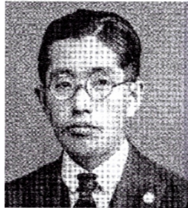
生前の山本宣治(1928年 労農党のバッジをつけて)

今年、山本宣治(山宣・1889年5月28日〜1929年3月5日)の生誕134年、死後94年です。2019年3月、終焉の地、東京都千代田区神田、東京都千代田区神田保町に区が「まちの記憶」として「山本宣治終焉の地」のプレート(左下写真)を建てました。