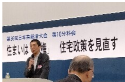
住まいは「人権」の分科会

二つの学習講座に参加しました。まず一つ目は気候危機の講座で温室効果ガスは毎年出す量が増え、そして原因に責任の無い人たちが深刻な影響を受ける。即、排出制限に舵を切らないと実現不可能になってしまう。そのために必要な資金、技