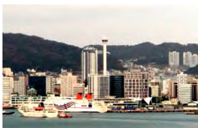
釜山港から釜山市街を望む