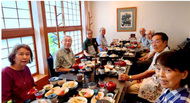
撮影会後のひととき

★【事務局より】自転車による自損事故(段差で転倒、障害物を避けようとして転倒など)の場合でも、警察への届け出、「交通事故証明」の提出が以前より厳しくなりました。「交通事故証明」を提出できない場合は、これに代わる第3者の発行する交通事故罹災証明、目撃証明、示談書などを提出してください。