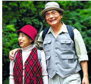
健康が一番！ (写真はイメージ)