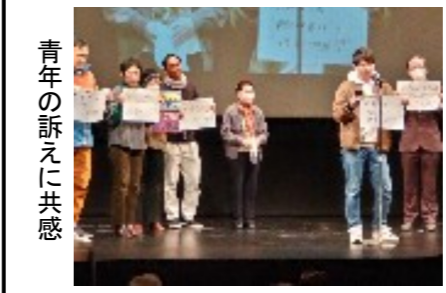
青年の訴えに共感

3月3日（日）にエール・シアターで「万博ストップ府民大集合」の集会があり、800人の席は満席でした。集会は、「万博自体が時代遅れなうえに、異様なムダ使い」「今やカジノの露払いでしかない」「これだけの費用を使ってまで実施する価値があるのか」と言うことで実施されたものです。