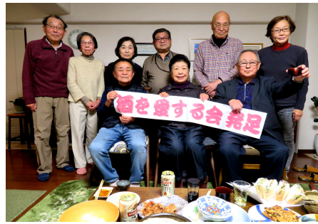
発足会に 集まった皆さん