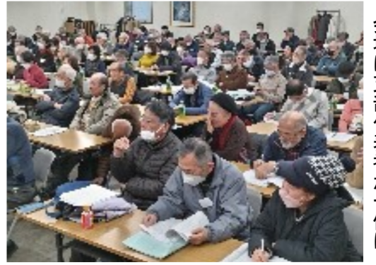
【お知らせ】3コマまんが『そりやないで』は特集の為次号になりました。会場は支部代表者が一体に