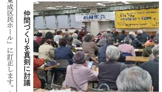
仲間づくりを真剣に討議