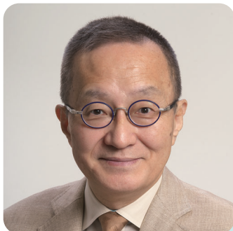
日本共産党衆議院議員 笠井 亮