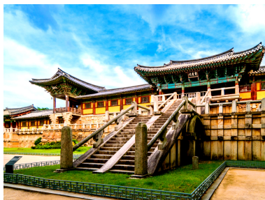
(右・甘川左・仏国寺)

御鳳輦を陸を歩いて川岸まで送る神事が「陸渡御」(写真)です。当日は大阪天満宮を午後3時半出発予定です。昼の12時ごろから大阪グリーン会館の6階の会議室を開放しますのでご利用ください。