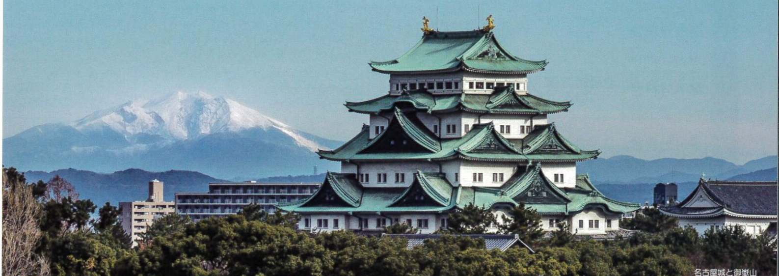
名古屋城と御嶽山