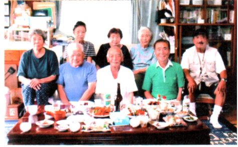
友達会のメンバーと 前列左から二人目

去年の秋 久しぶりに田舎へ帰ってきました。最初は船で別府港へ着き、それから自転車で山越えして熊本へ帰郷の予定でした。しかし出港に間に合わず翌日の新幹線になってしまいました。旧友たちとの再会は同