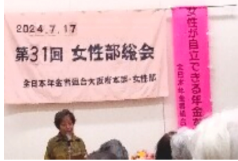
支部の代議員として発言

7月17日(水)グリーン会館2階大ホールにて13時30分より「第31回女性部総会」を開催しました。昨年5月に5類に移行されたコロナ感染症ですが、最近罹患したとよく