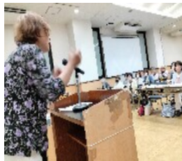
熱弁をふるう代議員