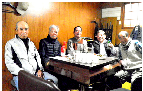
「平だん」年間最優秀者 表彰式で歓談

「平だん」は、組員が趣味の囲碁や健康麻雀などを楽しみながら親睦を深める目的で、2018年の4月にスタートしました。