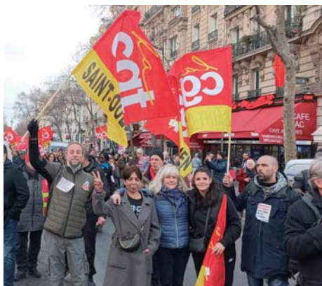
年金改革に反対するフランスのデモ(2023年2月)

私たちは、誰もが安心できる年金制度への改善を求めています。政府は軍事費を増大させるため、増税をすすめようとしています。将来に希望が持てる年金制度を実現させるよう署名にご協力ください。