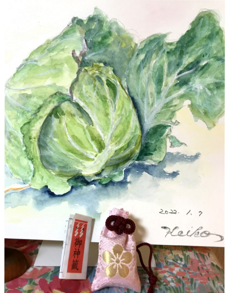
とれとれのキャベツ

月1回 第1火曜日に水彩画を楽しむサークルです。畑でとれとれのさつまいも、キャベツ、白菜などの野菜や季節のフルーツ、花々を描いています。