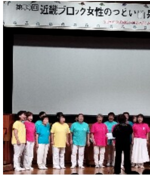
合唱団の力強い歌声