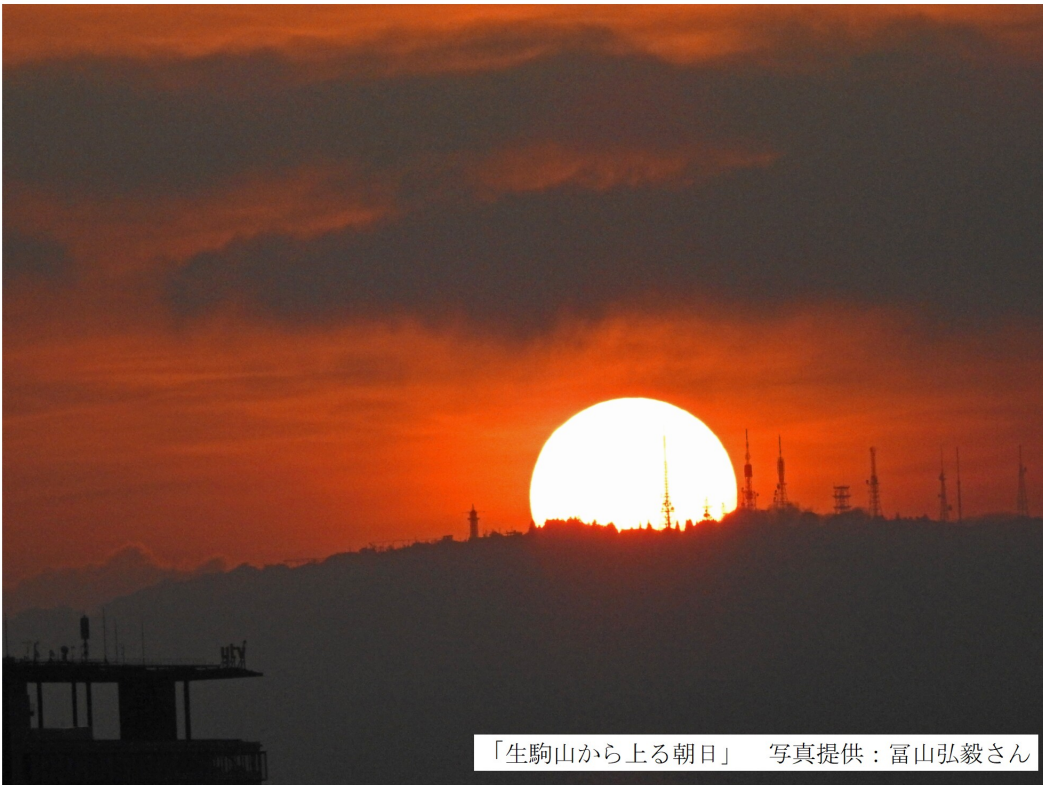
「生駒山から上る朝日」