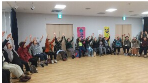
腕をあげパワー全開の参加者

11月14日、枚方市駅前の生涯学習交流センターで総会を行いました。9月にオープンしたばかりの会場なので男性2人に会場案内してもらいました。議案書報告の後、組合員からは外出支援拡充の取り組み、社会保険への不服審査請求と共に介護等の独自施策を市に要求していくことなど活発な意見交流ができました。12月2日以降、既存の保険証廃止に対する不