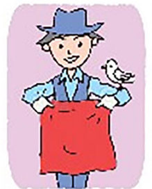
マジックショーの開始

第26回女性部総会が48人の参加で開催されました。部長の挨拶を始め1年間の経過や活動について報告がありました。今年3月に72人参加でおひな祭り、4月に4年振りに青春18切符の旅に43人参加、7月のグルメ会には57人参加で其々楽しみました。女性部主催の小物作りと、8歳のお誕生日の方にささやか