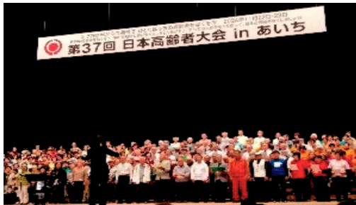
300人を超す参加型男女混声コーラスはまさに圧巻の歌声

立冬も過ぎいよいよ本格的な冬に向かう11月22・23日に左記の要領で高齢者大会が名古屋にて開催されました。