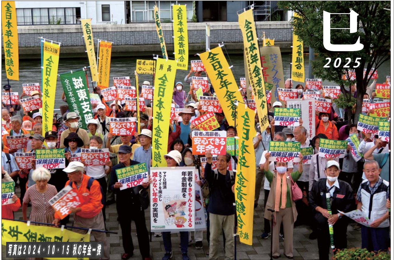
写真は2024・10・15 秋の年金一揆